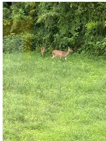
ペンネーム：山崎まさよ

8月の半ば頃、自宅の裏に鹿の親子が現れました。住宅地なのですが元々畑だったところが分譲されたので、山があり畑も残っています。かれこれ13年ほど住んでいます。かれこれ初めてのことで、まさかこんな近くで鹿と共存していたなんて驚きでした。数日後、以前とは少し離れた場所に出没したので今度は動画を撮ろうとスマホを構えました。すぐにどこかへ行ってしまいました。それからというもの、裏に出る度いつでも探しています。どこかに鹿の姿を。草むらの中、茂みの辺り、そんな頻繁にいるはずもないのに・・・。 今度現れた時は煎餅を撒いて餌付けしようと企んでいます。