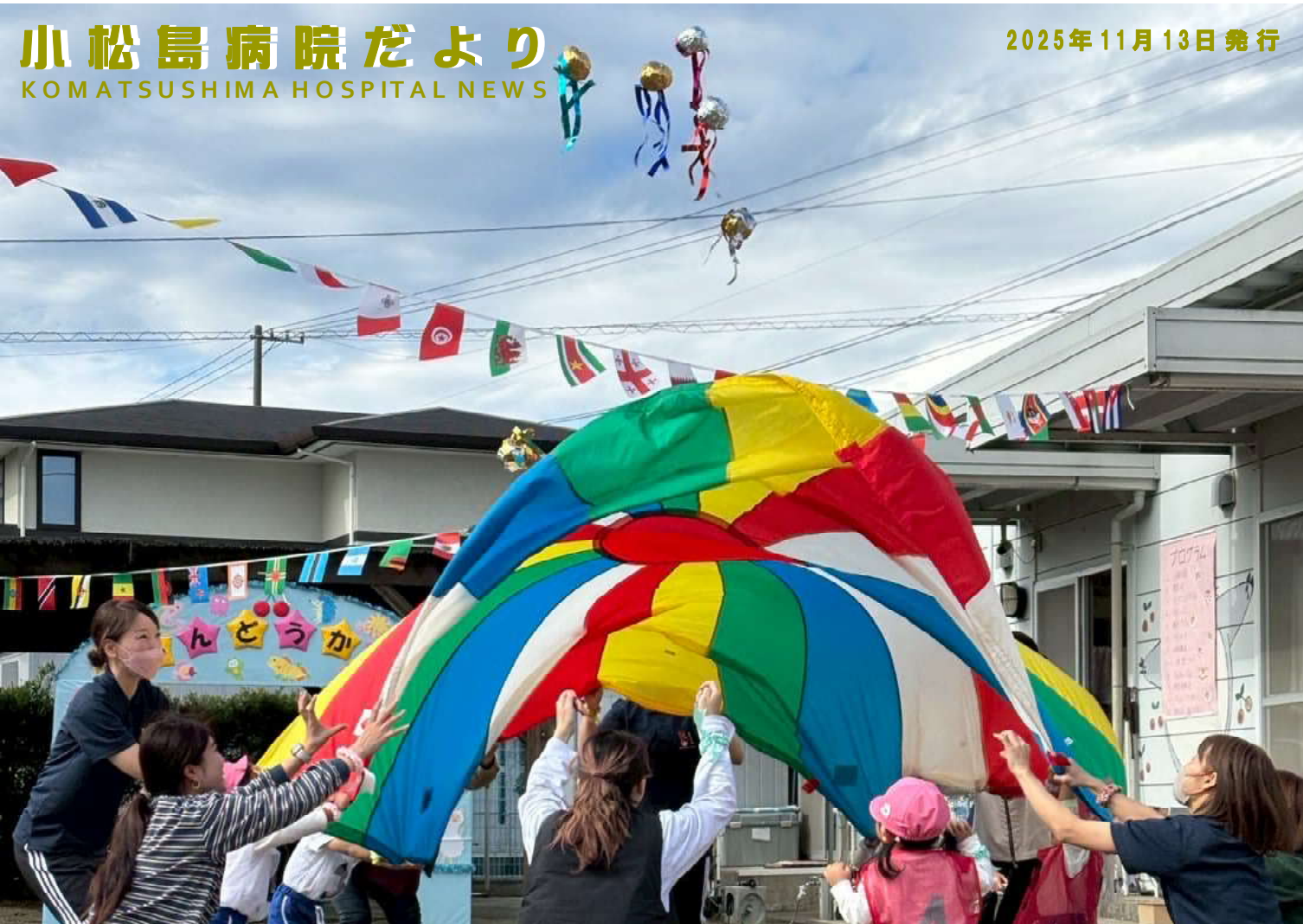
11月1日さくらんぼ保育所運動会の様子