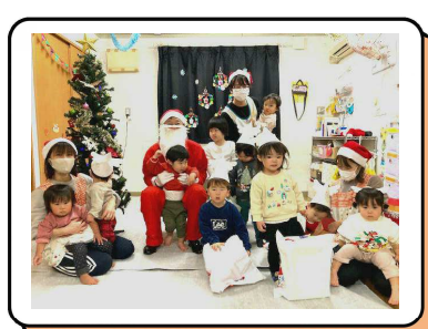
サンタさんと一緒に「はいポーズ」