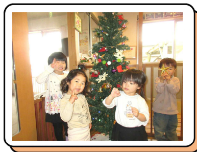
クリスマスマスツリーの飾り付け！