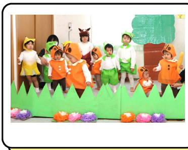
「どうぞのいす」のオペレッタをしたよ