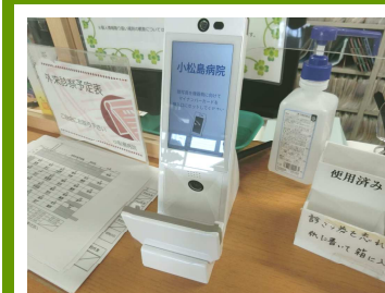
受付カードリーダー

さ窓にざごよが医示窓ド シイ働 い口おい不うス療い口をマてン省当 。に電ま明にム保たでおイお資が院 お話しなな|険だ保持ナリ格進で 問また点リズのか険ちンま確めは、 合たらなまに資な証でバす。をオ厚 せはおどす行格くをあ!。をオ厚 く受気が。え確てこれカ 導生 だ付軽ご る認も提ば! 入ラ労