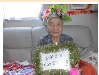
お誕生日 おめでとうございます！