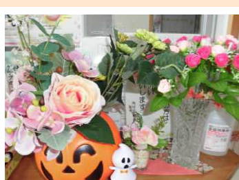
ハッピー ハロウィン♪